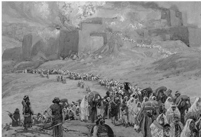
James Tissot (1836-1902), The flight of the prisoners

mir. Weil ich es jeden Tag neu versuchen kann. Das empfinde ich als großes Geschenk. Immer wieder neu anfangen zu dürfen, weil Gottes Gnade ewig gilt; er das in der Taufe geknüpfte Band nicht durchtrennt. Kann ich das glauben mitten in den Katastrophen der Welt und den Leiden meines eigenen Lebens? Ich kann es nicht glauben, wenn ich die Worte des Propheten missverstehe als Versprechen, dass auf Erden und in meinem Leben alles gut wird. Davon spricht Jeremia nicht. Was er im Namen Gottes zusagt, ist, dass ich im Leid nicht mehr alleine bin. Eine Zusage, die in Jesus Realität geworden ist. Weil er gelitten hat und gestorben ist, bin ich im Leid und im Tod nicht mehr allein. Das kann ich schon im Hier und Jetzt erfahren.