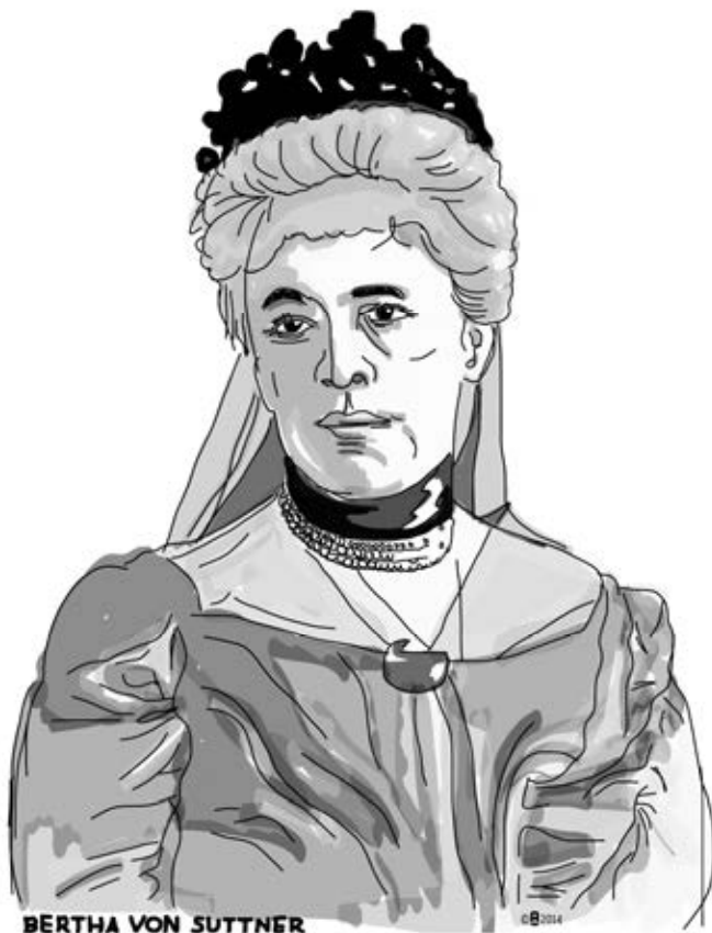
BERTHA VON SUTTNER

Vor 100 Jahren starb die Pazifistin Bertha von Suttner. (mehr auf S.11)